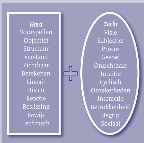
Figuur: Harde en zachte elementen in de dialoogbenadering