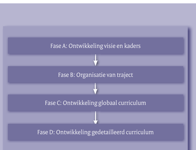
De fasen van curriculumontwikkeling